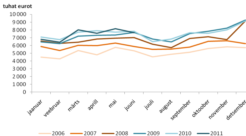
Joonis 3. Ravimikasutus kuude lõikes 2006 – 2011

Kuude lõikes ei ole ravimikasutus eelnevate aastatega võrreldes oluliselt muutunud.