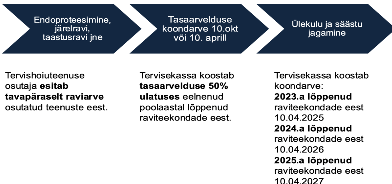
Joonis 1. Tasumise põhimõtted [muudatus kehtib alates 01.01.2025]

4.7.6. Tervisekassa kohustub 2023.a III kvartali jooksul looma ja TTO-le kättesaadavaks tegema vajadustele vastava ja kooskõlastatud mõõdikute ning kulude jälgimise töölaua.