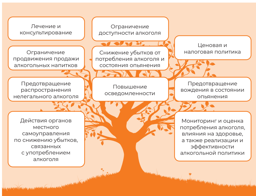
Рисунок 1. 10 областей деятельности из зеленой книги алкогольной политики

Из приведенных десяти областей деятельности области здравоохранения прямо касаются только лечение и консультирование. Для снижения злоупотребления алкоголем важно создать сеть, объединяющую все уровни, с привлечением специалистов из различных областей. Исходя из этого, в 2014 году была начата разработка руководства по лечению «Ведение пациента с расстройством, вызванным употреблением алкоголя» (Консультативный совет по клиническим руководствам 2020). Руководство, в основном, включает в себя методы лечения пациентов, злоупотребляющих алкоголем или зависимых от него, но также прослеживает весь путь пациента в системе здравоохранения и рассматривает угрожающее здоровью потребление алкоголя. Ниже приводится алгоритм руководства по лечению, описывающий путь пациента.