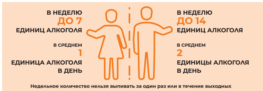
Рисунок 3. Границы низкого риска употребления алкоголя