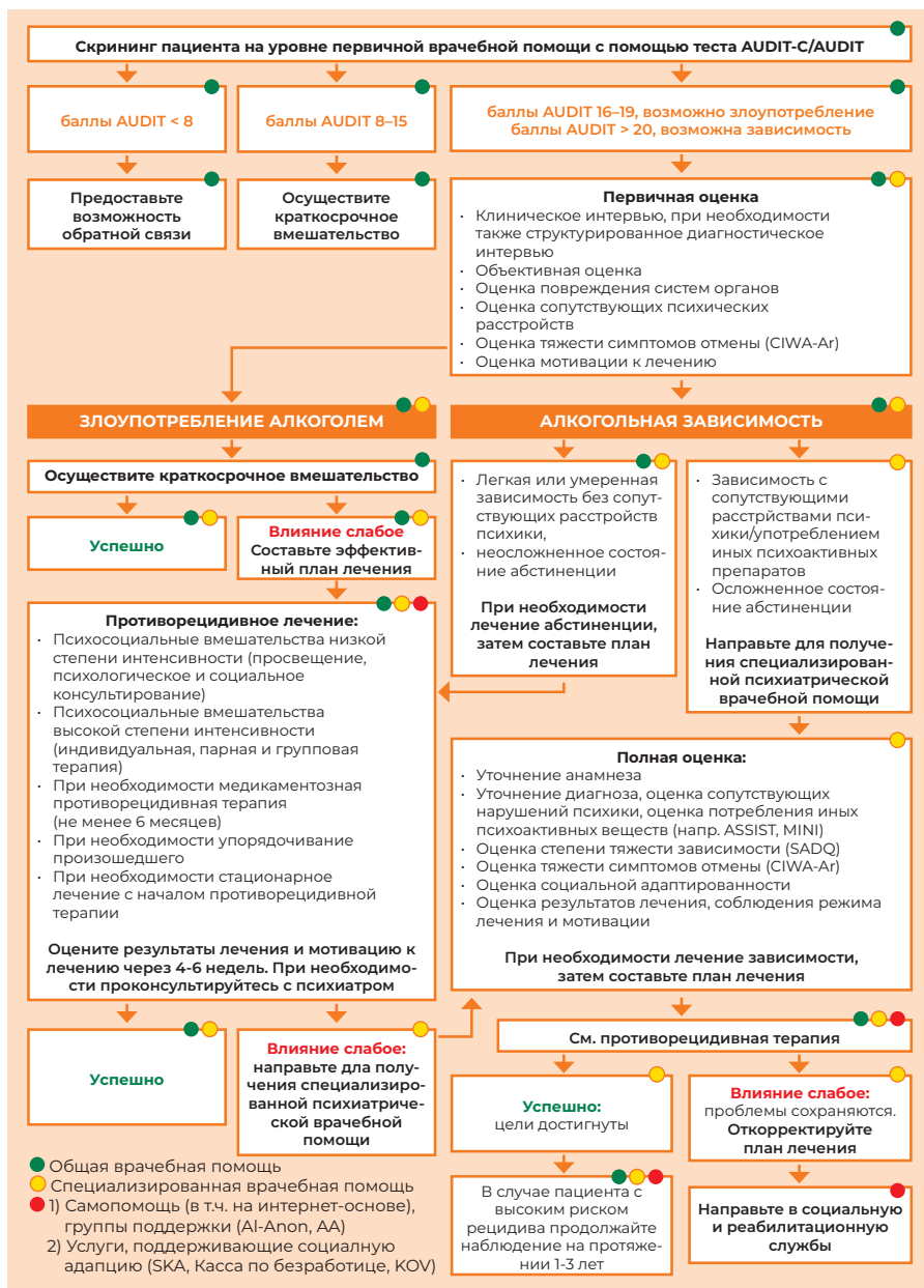
Рисунок 2. Алгоритм ведения пациента с расстройством, вызванным употреблением алкоголя (Консультативный совет по клиническим руководствам 2020).