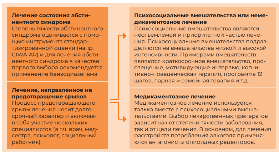
Рисунок 10. Лечение расстройств потребления алкоголя

Лечение диагнозов F10.1 (злоупотребление алкоголем) и F10.2 (алкогольная зависимость) проходит длительно и предусматривает работу в команде. Лечение может проходить как в отделениях общей, так и специализированной медицинской помощи и проводится преимущественно амбулаторно. Основными частями лечения расстройств употребления алкоголя являются: