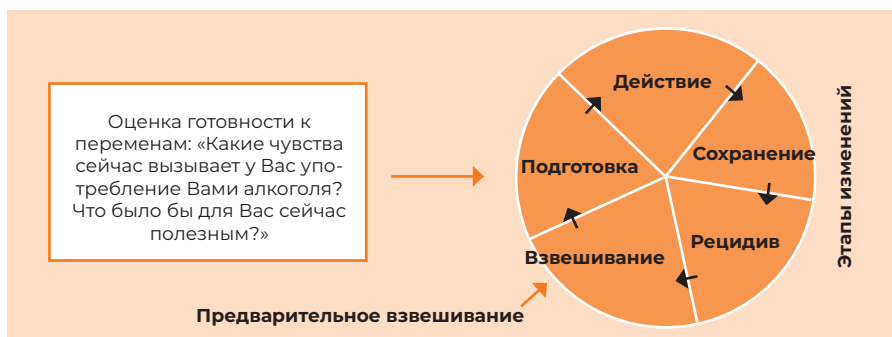
Рисунок 8. Модель изменений (Prochaska, DiClemente 1983)

Следующий способ подхода следует выбрать в соответствии с тем, на каком этапе изменений находится пациент. Ниже приводится краткая таблица, описывающая, какой метод подхода следует выбрать на конкретном этапе. Важно помнить, что нет необходимости в прохождении всех этапов, и можно испробовать другие способы подхода.